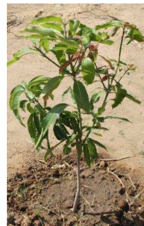
Manguié de 8 mois