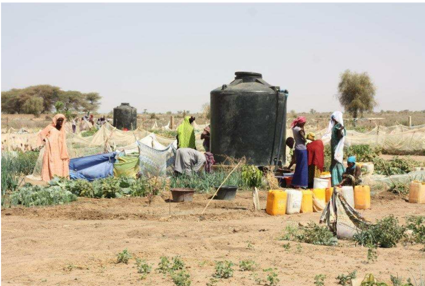
Les 2 cuves en séries sur le puits n° 2