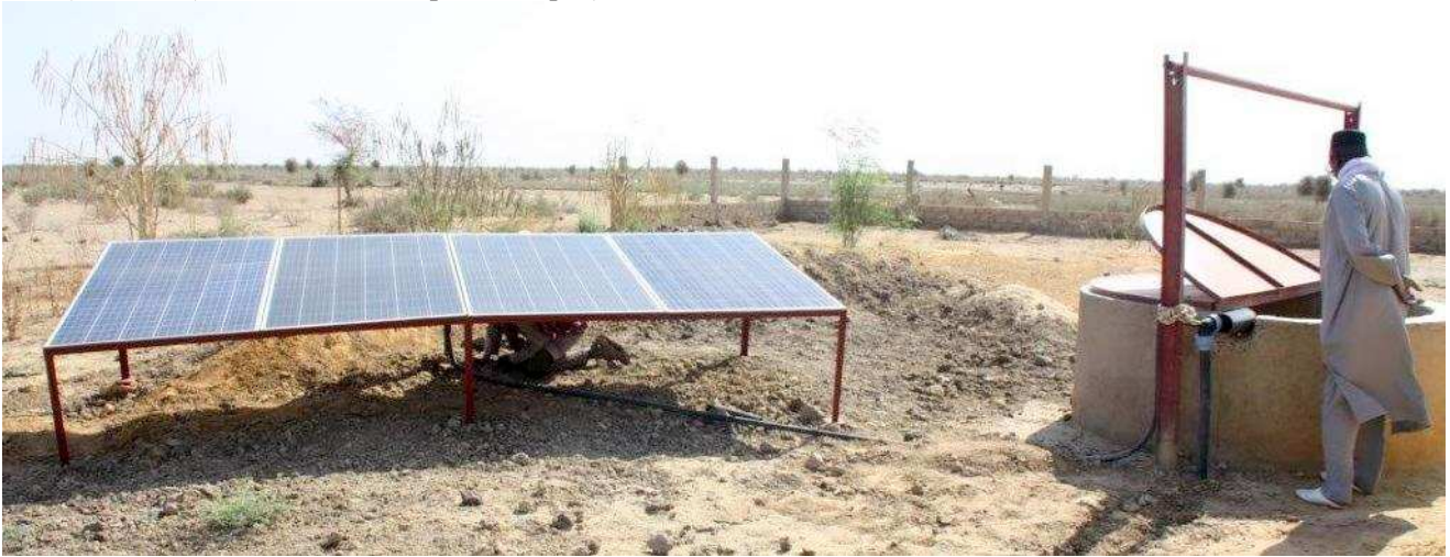
Équipement d'un puits en pompe immergée à 15 m et panneaux solaires

Chaque puits est équipé d'une électropompe immergée de Type 4SP5/6A. Une telle électropompe assure un débit de 5m 3 /h à 25 m HMT (moteur 0.55 w ; ici, l'eau est puisée à 15 m) ; chaque pompe est alimentée par 4 panneaux solaires de 245 w. Un système de 4 cuves de 5m 3 chacune (2 cuves en série par puits) permet une distribution de l'eau bien répartie sur tout le périmètre. Ce travail d'aménagement, terminé en mars 2019, a été validé sur place par une mission de réception de M Moulinier (CERADS). Cette deuxième phase du projet est donc réalisée.