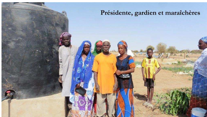
Présidente, gardien et maraîchères